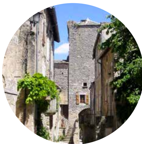
Cités templières du Larzac 10 min