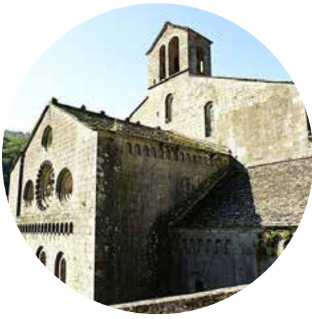
L'Abbaye de Sylvanès 55 min