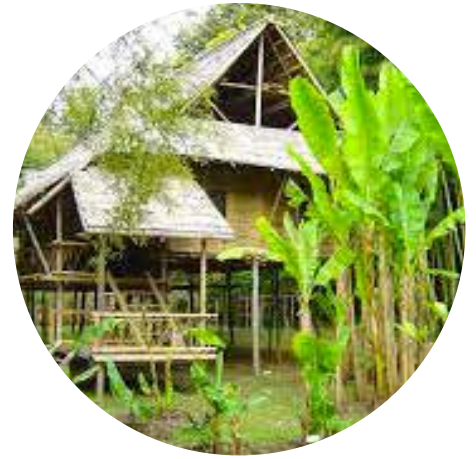
Bamboueraie d'Anduze 50 min