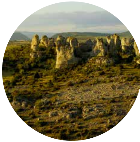
Le Larzac sur place