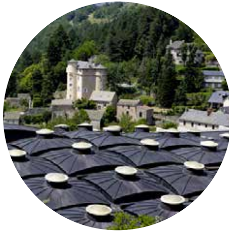
Micropolis 30 min