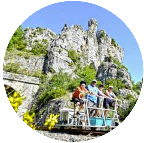
Vélo-Rail 10 min