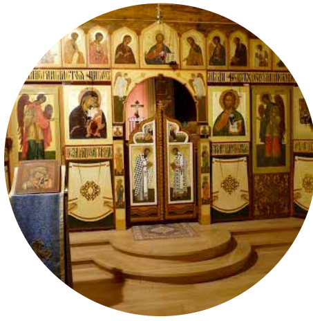
Eglise orthodoxe de Syvanés 55 min