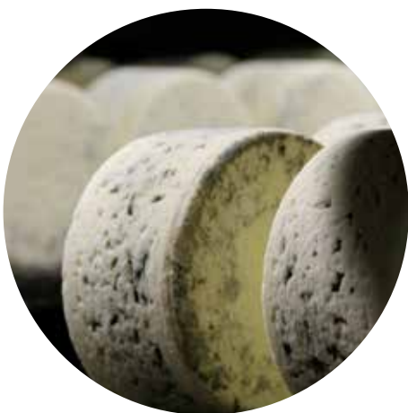
Roquefort 20 min