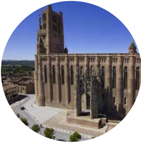
Cathédrale d'Albi 2h