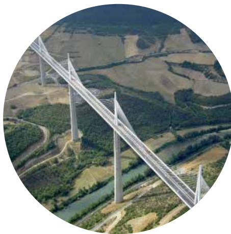
Vol au dessus du viaduc en autogyre 10 min