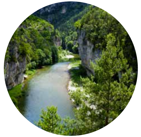
Les gorges du Tarn et de la Doubie - 50 min