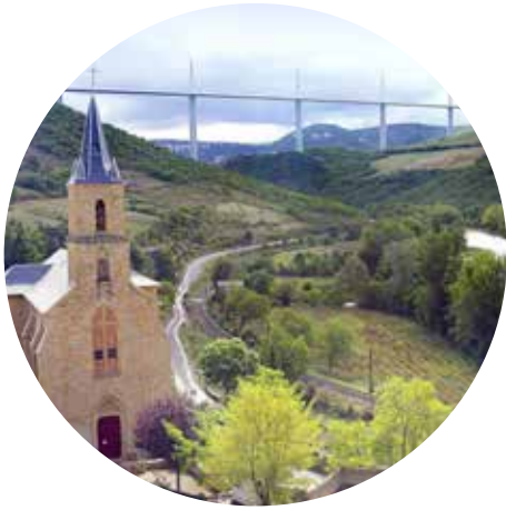
Millau et son Viaduc 20 min